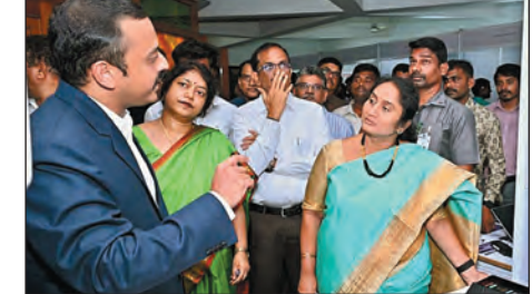
పాల్గొని మాట్లాడారు. ఈడబ్ల్యూఎస్ వర్గాలను ఆర్థికంగా బలోపేతం చేయడానికి, వారికి పారిశ్రామిక రంగంలోకి తీసుకురావడంపై ప్రభుత్వం దృష్టిసారించినట్లు వివరించారు. ఇప్పటికే ప్రకృతి వ్యవసాయంపై అవగాహన