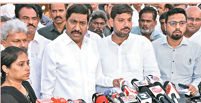
అన్నారు. భవిష్యత్తులో విద్యుత్ లైన్లు, డబుల్ డెక్లర్ వంటి రైళ్లకు ఇబ్బంది లేకుండా ఆర్కేబి ఎత్తును పెంచుతున్నామని అన్నారు. 2027 మే నాటికి ప్రాజెక్టును పూర్తి చేస్తామని అనునిత్యం కూటమి నేతలు, ప్రభుత్వ అధికారులు ఈ ప్రాజెక్టును పర్యవేక్షణ చేస్తున్నారని అన్నారు. గుంటూరు జిల్లాలో 974 కి.మీ.